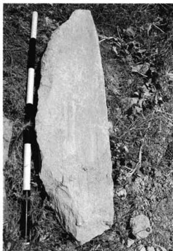
Lám. I.- Estela IV de la "Atalaya de la Moranilla".