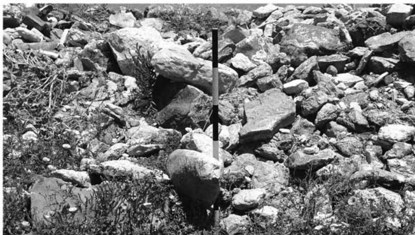
Lám. II.- Acumulación de piedras en un extremo del yacimiento en el que se localizó la estela.